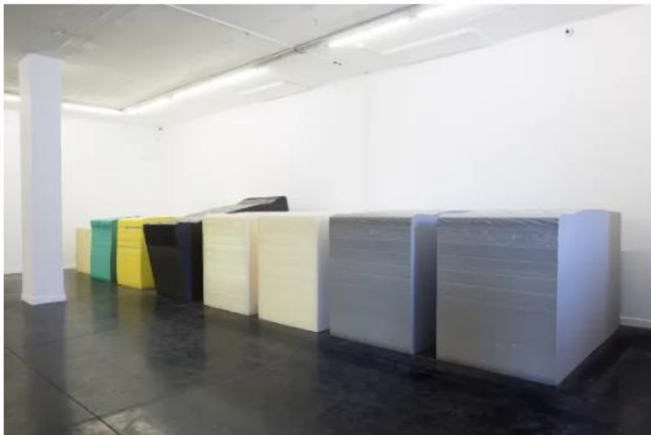
מתוך המיצב "בריא ושלם" של רוני חג'ג', בגלריה רו ארט בתל אביב.

הכוח הגדול של "בריא ושלם", מעבר לבחירה אמנותית זו או אחרת, טמון בריבוי הרבדים שמתקיימים בה, אשר תומכים ומשלימים זה את זה; הצורני, החומרי, הסמנטי, הגופני, הפרפורמטיבי, אם למנות רק כמה, יוצרים יחד תדר ברור, ערב וצורמני בעת ובעונה אחת. "בריא ושלם" אינה תערוכה "יפה", ונראה שהתבוננות היא כלל לא הדבר העיקרי שהיא מזמנת. נדמה שכדאי להפעיל עוד יכולות חישה כדי להיכנס לתוכה, ולתת לה להדהד במלוא עוצמתה.