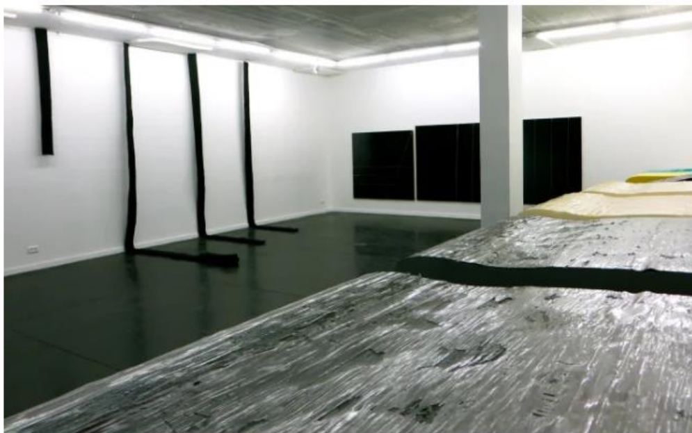
מתוך התערוכה "בריא ושלם" של רוני חגי'ג'

מהכניסה אל תוך החלל משמאל מובילה שורה מרווחת, במקצב שווה של צלעות שחורות רבועות המשתלשלות מקו המפגש שבין הקיר לתקרה. בניגוד לרווחים השווים, חגי'ג' קוטם כל אחת מהן במידה שונה ויוצר גרף סייסמוגרפי שתחילתו בגדם קצר המתארך והולך ואז שוב נקטם אך במידה פחותה, בטור מוסיקלי של תווים שחורים בלובן החלל.