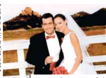
צ'רלי שין ודונה פיל, 5 חודשים