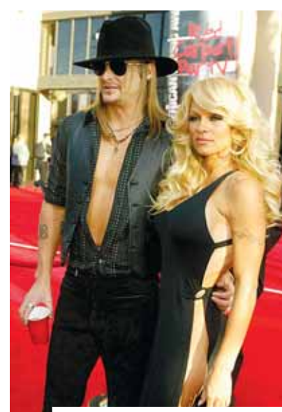
קיד רוק ופמלה אנדרסון, 4 חודשים