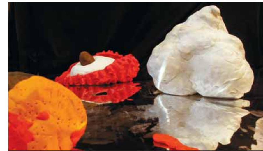
"מגש הכסף", נעם אדרי, 2011