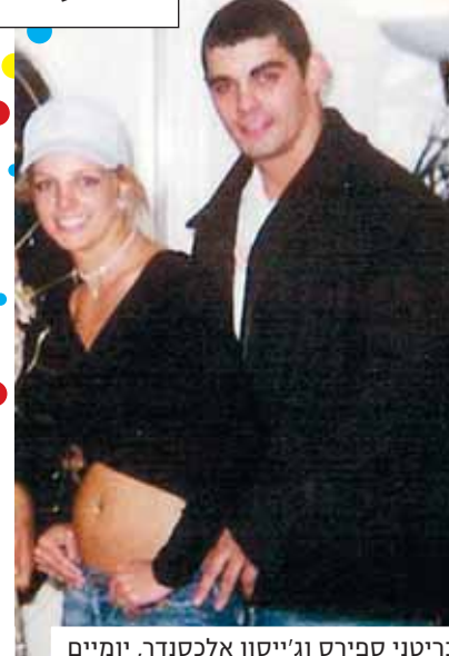
בריטני ספירס וג'ייסון אלכסנדר, יומיים