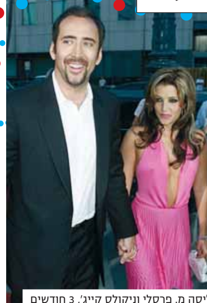
ליסה מ. פרסלי וניקולס קייג', 3 חודשים