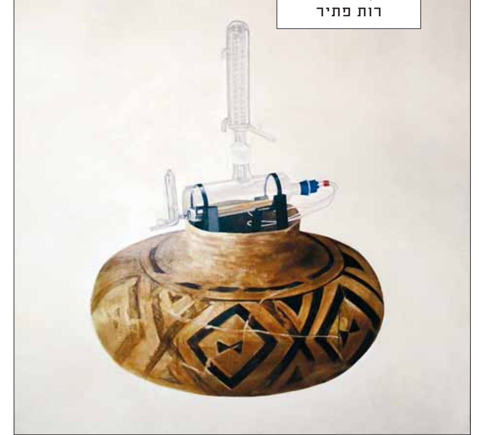
"Terra Cotta Vase", ליטל לב כהן, 2011