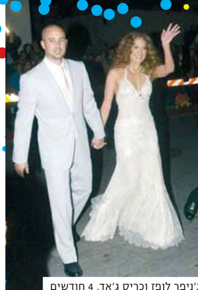
ג'ניפר לופז וכריס ג'אד, 4 חודשים