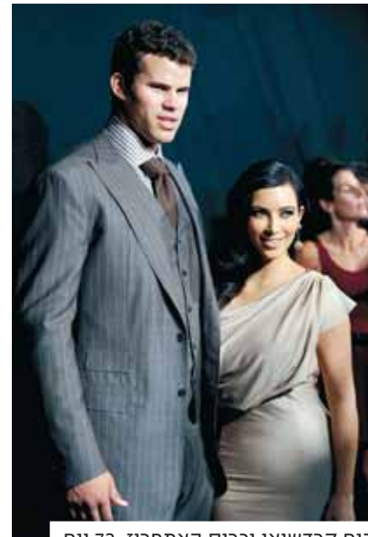
קים קרדשיאן וכריס האמפריז, 72 יום