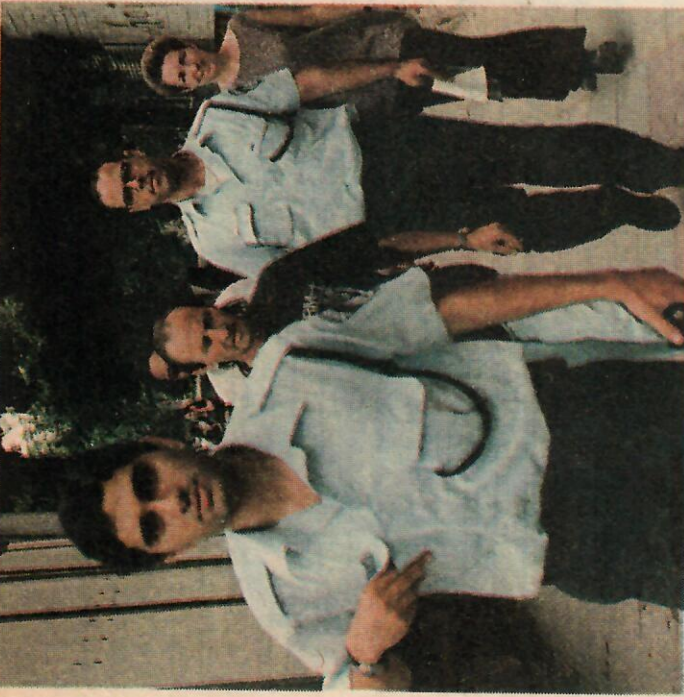
שומרים עם מציינים בתערוכה: חסר הבית מורקו ור"י המלינג

שום פולשים למבנה ציבורי בעלות העיירה, ולא למבנה פרטי. ואמנם, במשך שנים רבות הבניין עמד לרשות העיירה. במשך כ-60 שנה שימש בית ספר, האחרון שבהם בית-הספר הפתוח עד לפני כמה שנים.