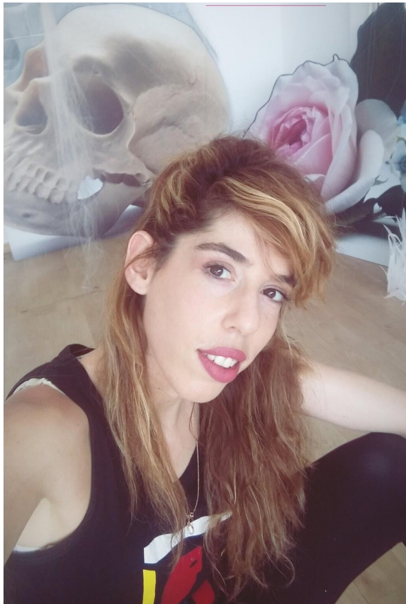
"הורגת אנשים על ימין ועל שמאל". להלי פרילינג

אך אל דאגה. לא מדובר באדם בשר ודם, אלא בעבודת אמנות (פסל, או מיצב, אם תרצו), שמהווה חלק מאירועי "אוהבים אמנות. עושים אמנות" שיתקיימו בסוף השבוע הזה (12.11-14) ברחבי העיר. מדובר במיזם ותיק של עיריית תל-אביב-יפו (השנה בשיתוף האיחוד האירופי), שמתקיים זו הפעם ה-18, ובמהלכו נפתחים עשרות חדרי עבודה של אמנים לקהל הרחב, לצד עשרות פעולות אמנותיות ברחבי העיר. בשל מגבלות הקורונה, השנה החליט הצוות, בראשותו של האוצר הראשי אבי לובין, לקיים את כל האירועים במרחב הציבורי, וגם הביקורים בחדרי העבודה ייערכו במתכונת מצומצמת. התמה של התערוכה המרכזית השנה היא "שמיים פתוחים", משהו שאנחנו רק יכולים לפנטז עליו כרגע.